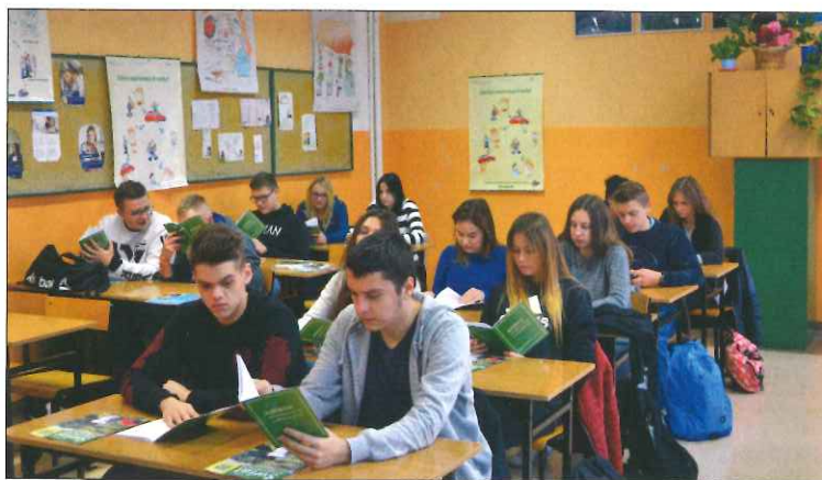
Zajęcia z etyki w rachunkowości

Uczniowie Zespołu Szkół Ekonomicznych bardzo cenią sobie współpracę ze Stowarzyszeniem. Szczególnie ważne są dla nich możliwości pogłębiania wiedzy i konsultacje z praktykami, dzięki którym jeszcze lepiej mogą być przygotowani do zawodu księgowego. Jako społeczność ZSE cieszą się z działań podejmowanych we współpracy z SKwP. Uczniowie, pytani „kiedy pierwszy raz usłyszeli o Stowarzyszeniu Księgowych w Polsce”, odpowiadają, że tutaj, w szkole – w ekonomiku, uczestnicząc w zajęciach prowadzonych przez wykładowców Stowarzyszenia. Dzięki tym spotkaniom mają szerszy pogląd na temat pracy księgowego oraz licznych obowiązków, dylematów etycznych, z którymi będą musieli zmierzyć się w swojej przyszłej pracy.